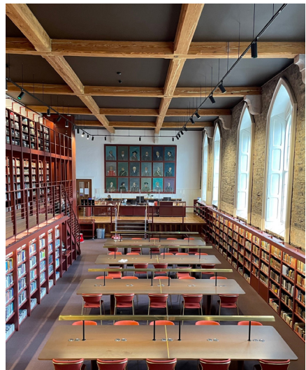
Dublin City University, Woodlock Hall Library

cet article est disponible sous licence CC-BY/4.0